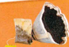
Marc de café, sachets de thé, mouchoirs usagés