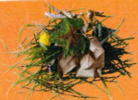
Déchets verts, tontes de pelouse, feuilles