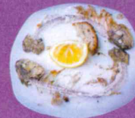
Restes de repas