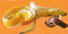
Épluchures, restes de fruits et de légumes