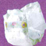
Couches, lingettes et autres déchets d'hygiène