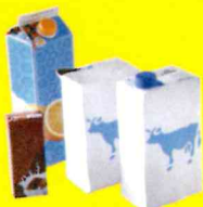
Briques non aplaties